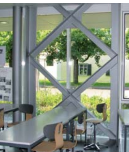
Schulhaus-Erweiterung Sarnen (OW)

Gestalterische Wirkung der Stahlelemente bleibt auch nach Brandschutz-Anstrich erhalten