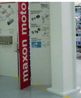
Fabrikationshalle Sachseln (OW)

Brandschutz-Anstrich auf Stützpfiler in industrieller Umgebung