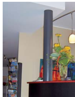
Hotel Kreuz Sachseln

Brandschutz-Anstrich auf Stützpfiler in industrieller Umgebung