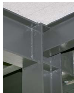
Schulhaus Amlehn Kriens

Gestalterische Wirkung der Stahlelemente bleibt auch nach Brandschutz-Anstrich erhalten